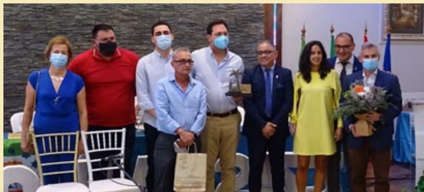
Centro de Salud de Fuente Palmera. Colono del año 2020