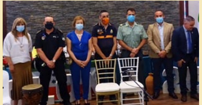
Representantes del Pueblo de La Colonia de Fuente Palmera. Colono del año 2020