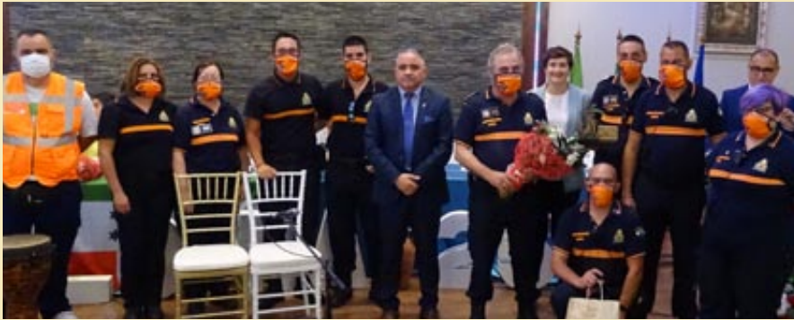
Agrupación de voluntarios de Protección Civil de la Colonia. Colona del año 2020